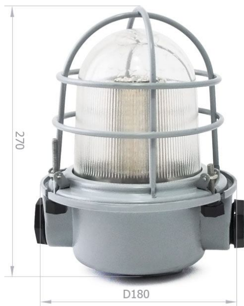
Рисунок 1 – Внешний вид светильника. Габаритные размеры для справки: D 180 мм, H 270 мм.